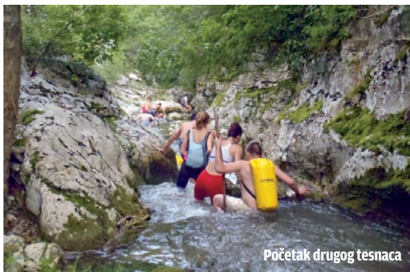
Početak drugog tesnaca

Kanjonung spada u ekstremne sportove, koji zahtevaju posebnu obuku i opremu, jer se za spuštavanje niz ekstremnije kanjone moraju koristiti alpinistička pomagala. Međutim, Brnjica je kanjon koji predstavlja zlatnu sredinu – dovoljno zahtevan da nudi uzbuđenje i adrenalinski doživljaj, ali zahvaljujući konfiguraciji prolaza i bez pomoći penjačke opreme, takoreći u „turističkoj“ varijanti. Osam kilometara nezaboravne zabave u vodi, između stenja i kroz gusto zelenilo, u čijim tesnacima postoje delovi koji moraju da se preplivaju, dok oni hrabriji mogu da se probavaju i u skakanju sa četiri metra visokog vodopada na me-